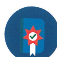
AUTORYZOWANE ZASOBY WIEDZY