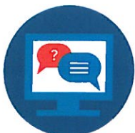
PORTAL + CZAT