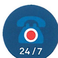
INFOLINIA TELEFONICZNA 24/7